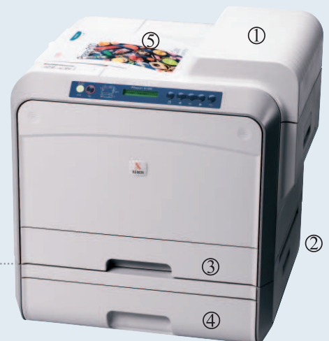
Phaser 6100DN mit optionalem 500-Blatt-Papierfach